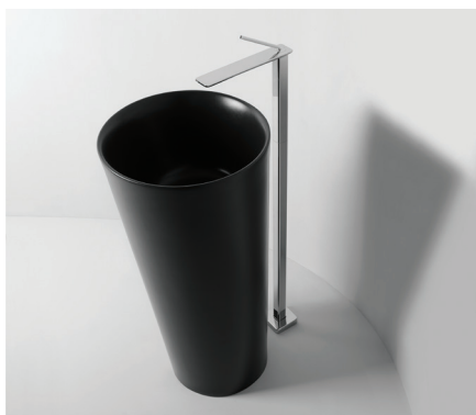
FREESTANDING Scarico a terra

Lavabo freestanding in ceramica con scarico a terra senza troppo pieno. Piletta esclusa.