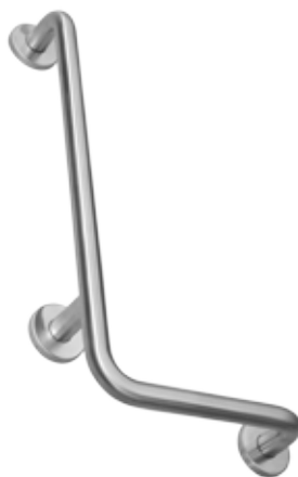
Na imagem / On picture / En la imagen - IN.12.009.D