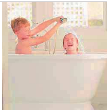
ÁGUA QUENTE SANITÁRIA

Assegure os seus duchos sempre a temperatura que deseja com o NEXT EVO X!