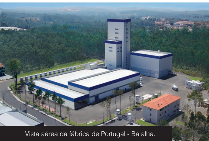
Vista aérea da fábrica de Portugal - Batalha.